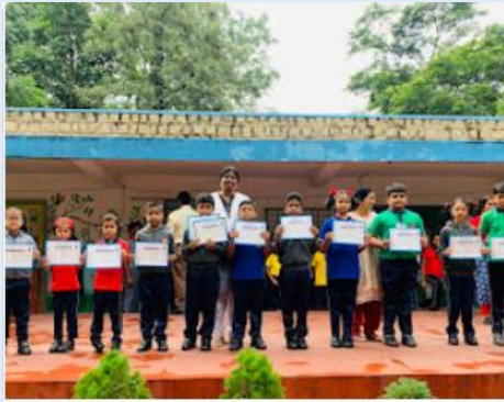
Best out of waste competition