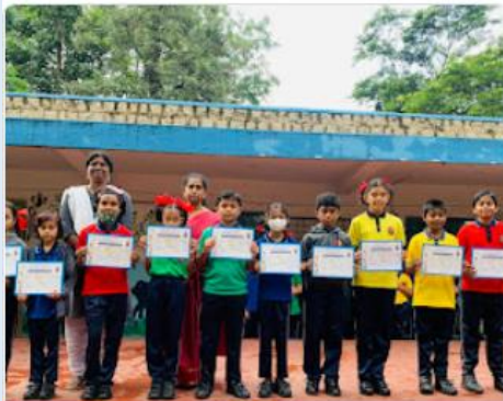
Memory Test competition