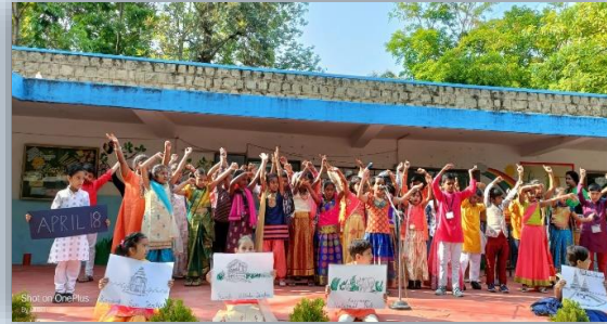
World Heritage Day celebration. On 18th April by Class III C