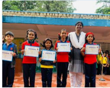
Classical Solo Dance Competition