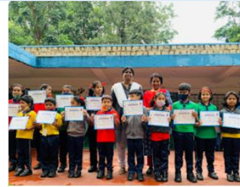
Clay Modelling Competition