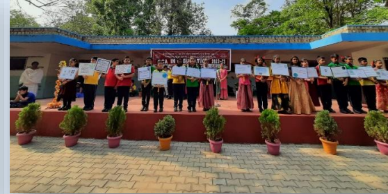
World Earth Day celebration. On 22 ND April by Class V A