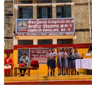
National Sports Day